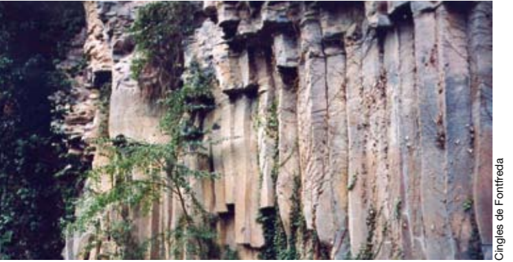
Cingles de Fontfreda

El territori del Parc és de propietat privada en la seva major part. Procureu que la vostra visita no destorbi la gent que hi viu.