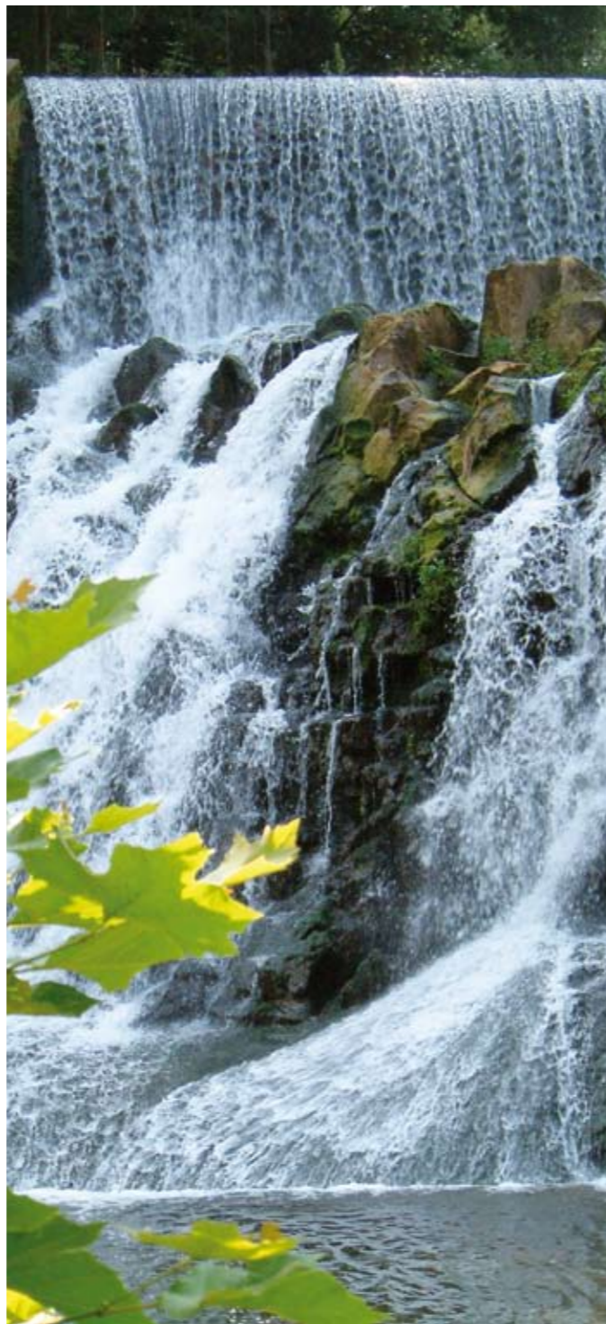
Salt d'aigua Molí Fondo

Molí Fondo és també el nom que es va donar a l'antiga fàbrica paperera que es pot veure en aquest indret i que va ser l'origen de la Torras Papel que es coneix actualment.