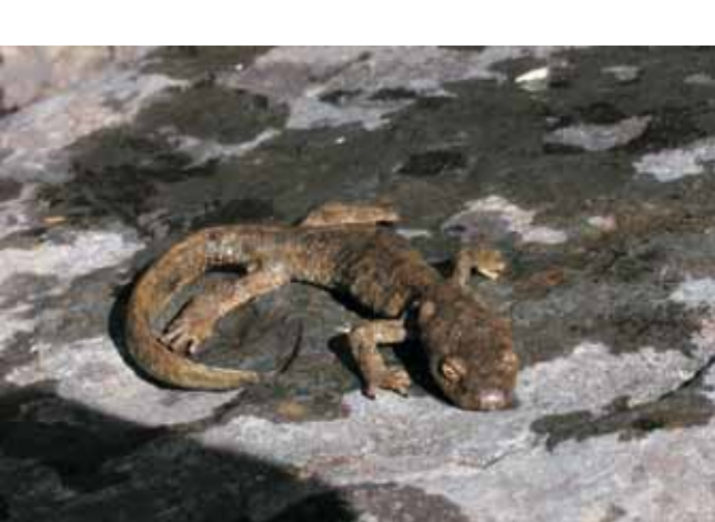
Tritó pirinenc (Calotriton asper)

Ponents: Aubèria, natura i patrimoni Trobada: 19h al Punt d'Informació de Castellbò (Alt Urgell)