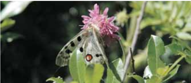
Papallona apol·lo (Parnassius apollo)

Recomanacions específiques: interessant portar guia de papallones i salabre (caçapapallones)