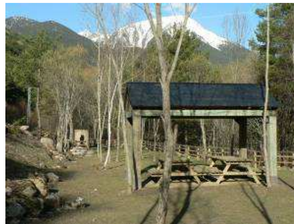
Área de descanso