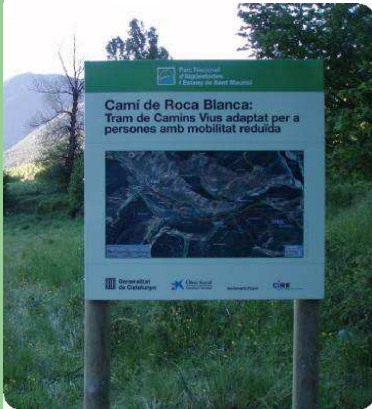
Cartel inicio del camino