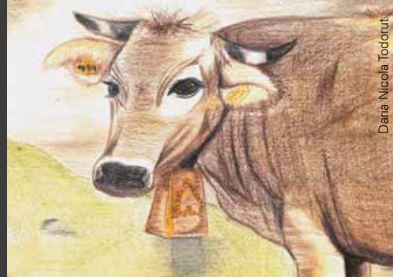
Daria Nicola Todorut