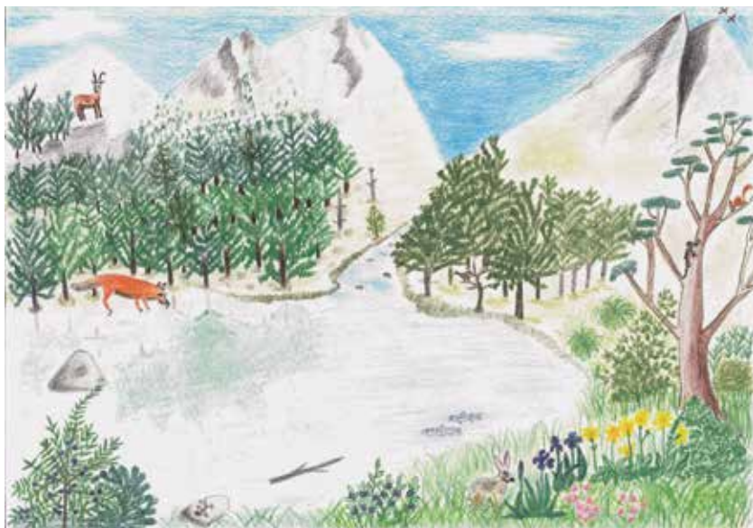
Dibuix portada: Oliver Serrano · Contraportada: Aleix Figuerola